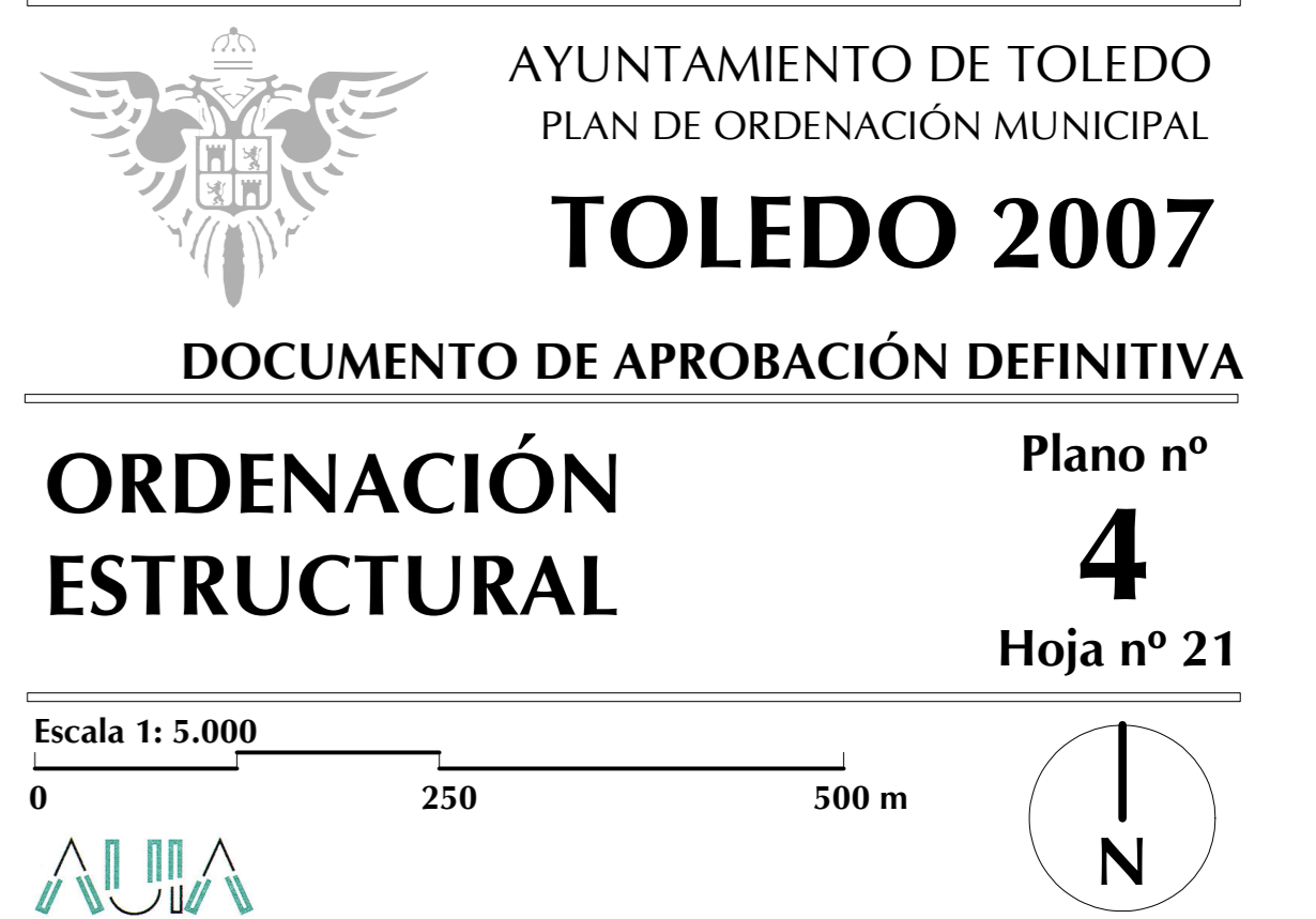
Localización sobre la cuadrícula 1:5.000 municipal